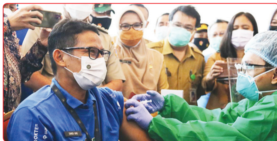
Menparekraf Sandiaga Uno divaksin Covid-19.

Dia menambahkan Vaksinasi Covid-19 para pelaku