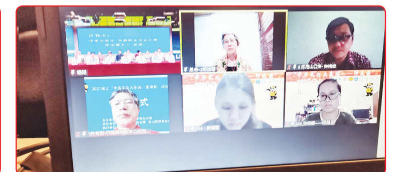
Para tokoh menghadiri konferensi online.