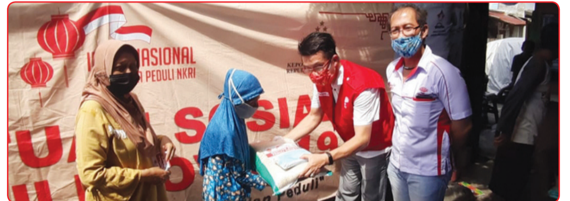
Pembagian beras dan masker di Kapas Lor.