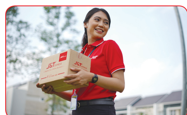
Sprinter J&T Express membawakan paket J&T Super.

Untuk 5 kota wilayah layanan baru J&T Super ini, J&T Express memberikan promo