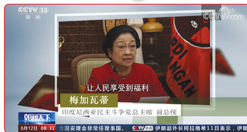
Ketua Umum PDIP Megawati Soekarnoputri mengucapkan selamat HUT ke-100 kepada Partai Komunis Tiongkok.

Bagi masyarakat manusia dan menjadi model bagi partai