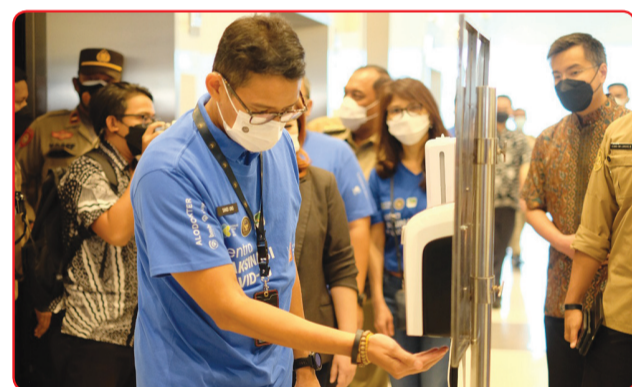
Menparekraf Sandiaga Uno mematuhi prokes dengan mencuci tangan.

Dalam program tersebut, program vaksinasi diberikan kepada pelaku parekraf di area Jakarta serta para atlet dan kontingen KONI DKI Jakarta yang akan bertanding di PON Papua XX/Papua 2021. • jhk/din