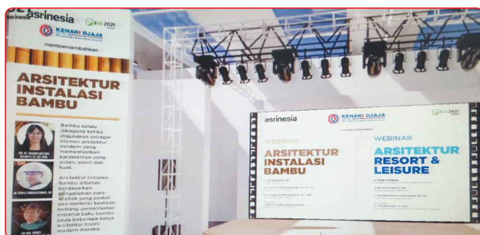
Para pembicara dan peserta peluncuran Indonesia Asri Expo (IAE) 2021 secara virtual.

Ari Tutuko menambahkan, dalam pameran virtual ini turut disertakan juga dunia pendidikan sebagai pusat sumber daya manusia kreatif dari beberapa perguruan tinggi, yang memiliki Prodi bidang Arsitektur, Desain