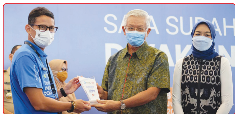
Pimpinan Agung Podomoro Land menyerahkan cenderamata ke Menparekraf Sandiaga Uno.