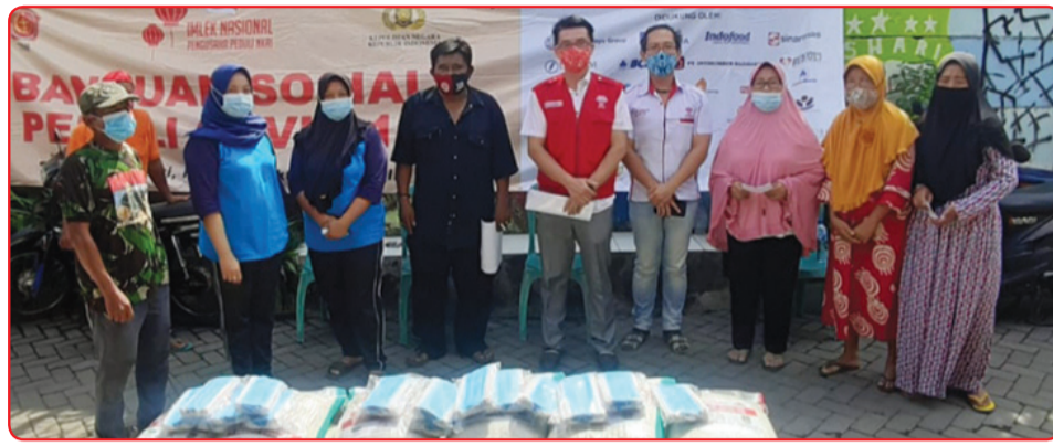
Pembagian beras di Dukuh Menanggal.

Selanjutnya di Kampung Baru, Bratang Tangkis 1 PDAM dibagikan 1.500 lb masker dan 75 paket beras @10kg. Mleto 35B (kos-kosan), Kel. Klampis dibagikan 54 paket beras @10kg dan