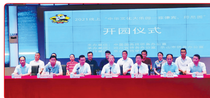
Pimpinan berbagai departemen terkait hadir dalam upacara pembukaan Chinese Cultural Paradise online.