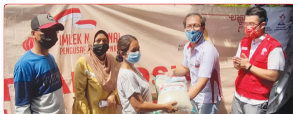
Pembagian beras di Dukuh Menanggal.

Program Nasional Pengusaha Peduli NKRI membagikan 1 juta beras dan masker, bekerjasama dengan TNI Polri dan Pemda setempat dalam penyalurannya untuk 6 provinsi di pu-