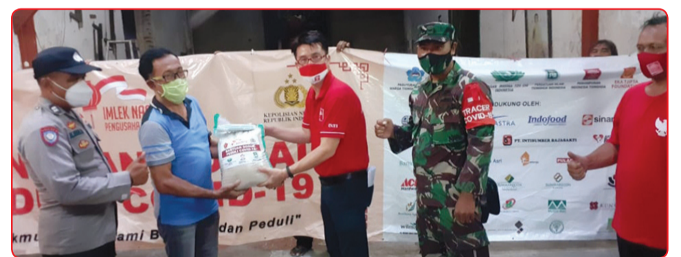
Pembagian beras di Tambak Bayan.