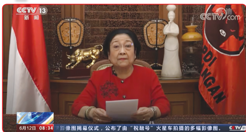
Ketua Umum PDIP Megawati Soekarnoputri mengucapkan selamat HUT ke-100 kepada Partai Komunis Tiongkok.

Menurut pemberitaan tersebut, para politisi dari negara-negara tersebut me-